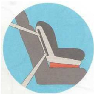
Лицом по ходу движения

Самое безопасное место для установки детского кресла в автомобиле — среднее место на заднем сиденье. Самое небезопасное - переднее пассажирское сиденье. Туда автокресло ставится в крайнем случае, при обязательно отключенной подушке безопасности.