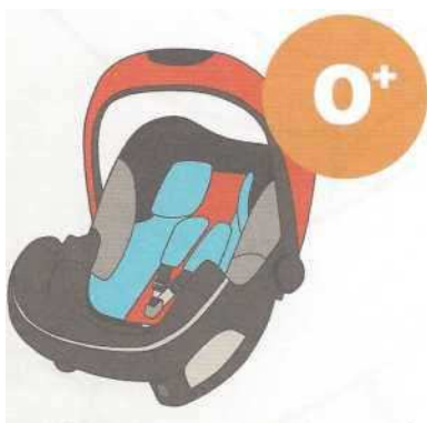
0-13 кг от рождения до 1 года

Покупайте кресло вместе с ребенком. Пусть он попробует посидеть в нем - прямо в магазине.