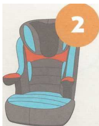
15-25 кг от 3 до 7 лет