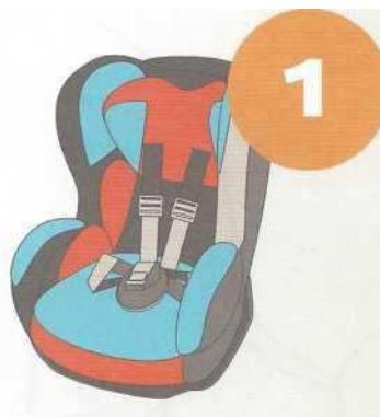
9-18 кг от 9 месяцев до 4 лет