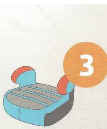
22-36 кг от 6 до 12 лет